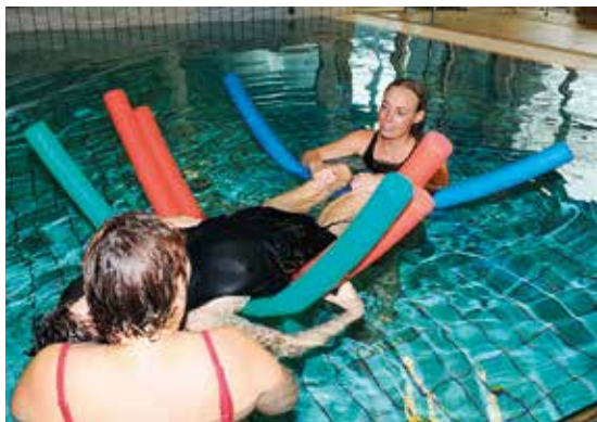
Beboer ”flyder” i vandet og der ses her ingen bevægelser

En del af det at tage til svømning med Tangkær er også at komme op at ”flyde” i vandet, hvilket nydes på højt plan. Vandet og det at komme op at flyde har en helt utrolig effekt på de ufrivillige bevægelser - når beboeren ”flyder” i vandet, så ses der ingen bevægelser og beboeren kan her slappe helt af og nyde at der er helt ro på. Sansestimuleringen i vandet giver lige præcis det der er brug for.